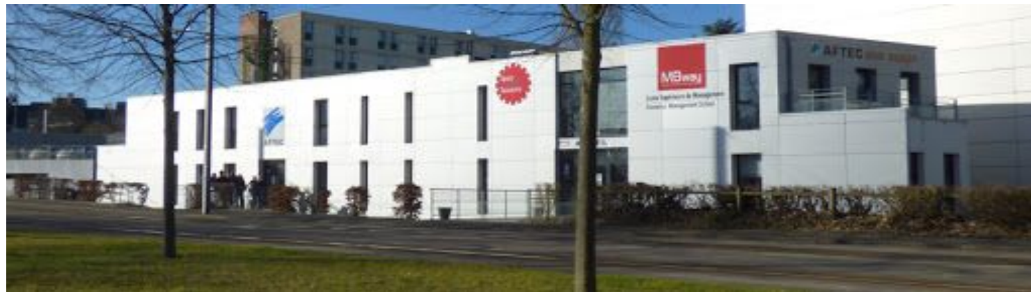
AFTEC de Caen - École supérieure de commerce