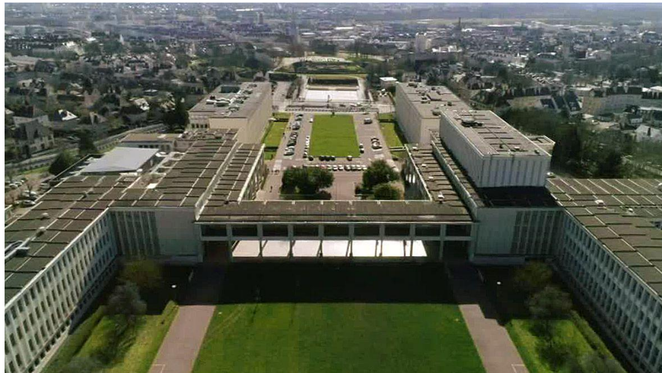
Université de Caen - Campus 1