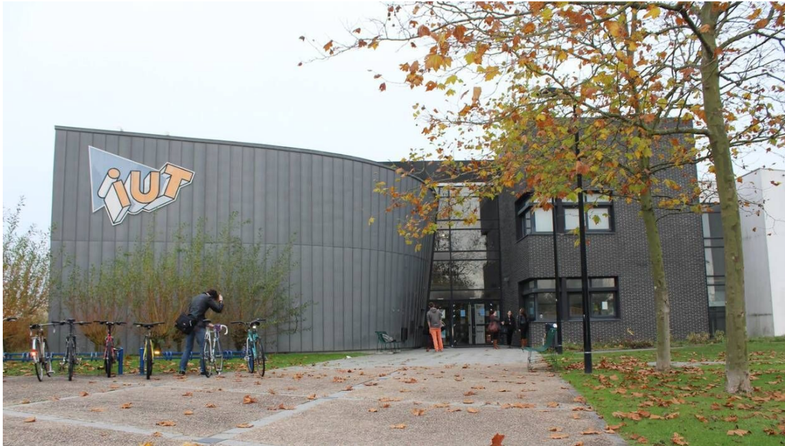
IUT Caen - Antenne Lisieux