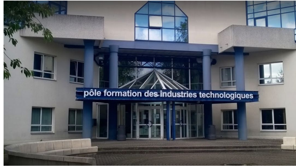
CFA Caen - Pôle industries technologiques